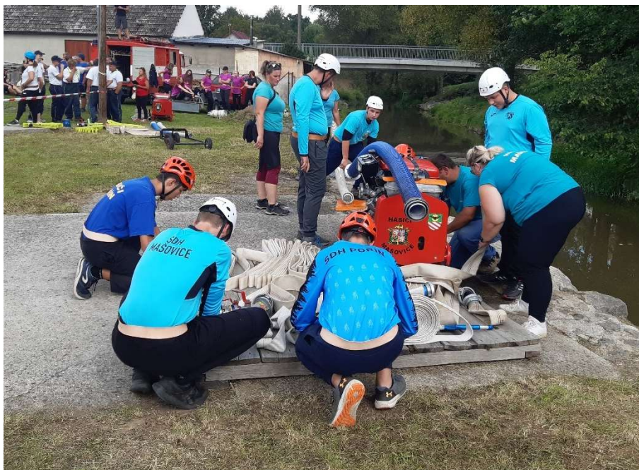
Memoriál Karla přívodníka v Zárybnické Lhotě