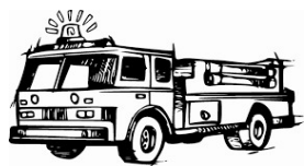
Návštěva hasičské zbrojnice V Chýnově