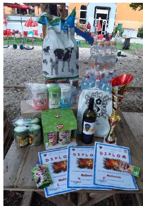
Memoriál Josefa Žahoura ve Veselí

Samozřejmě nežijeme jen soutěžemi, ale pořádáme spousty akcí během celého roku. Začínáme Masopustem, pak jsme vzali děti vydovářet se do Jump arény, což se jim hrozně líbilo. Následovalo vynášení Smrtky, velikonoční hodování, pálení čarodějnic, stavění máje, na podzim uspávání broučků, rozsvěcení stromečku, čerti a poslední den v roce nás čeká malý ohňostroj na naší cvičné louce.