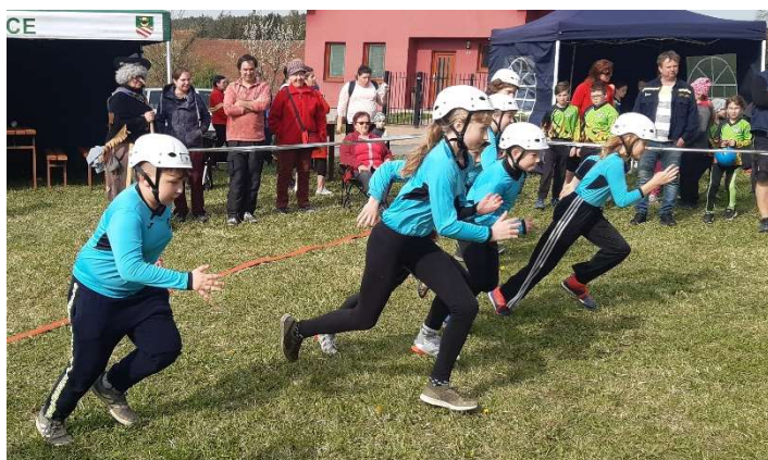
Soutěž MH Mašovice

Dospělí hasiči se zúčastnili v tomto roce hned několika soutěžích. První byla Okrskovka v Poříně, pak jsme navštívili soutěž v Náchodě (dost neobvyklé překážky), Srandamač s loďkou v DH, koncem srpna Přehořovský kopeček, kde se běží do kopce ke hřbitovu, následně jsme se zúčastnili našich oblíbených memoriálů v Zárybničné Lhotě a ve Veselí nad Lužnicí. V září jsme ještě zavítali do Věžné, kde se již tedy nesálo z rybníka, ale to vůbec nevadilo, soutěž se, i přes nevlídné počasí, vydařila.