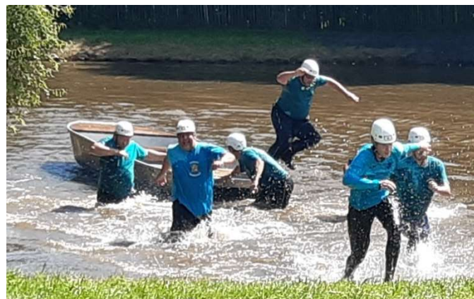
Srandamač Dolní Hořice